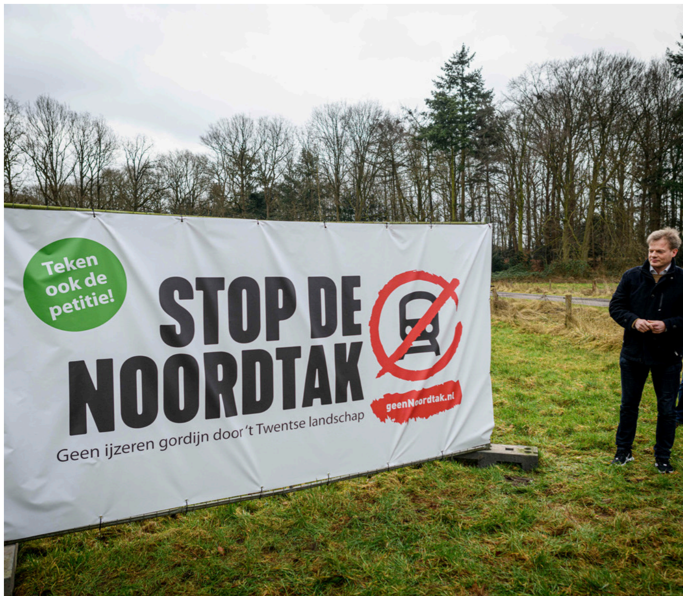
Start van de campagne 'stop de Noordtak' met Pieter Omtzigt.