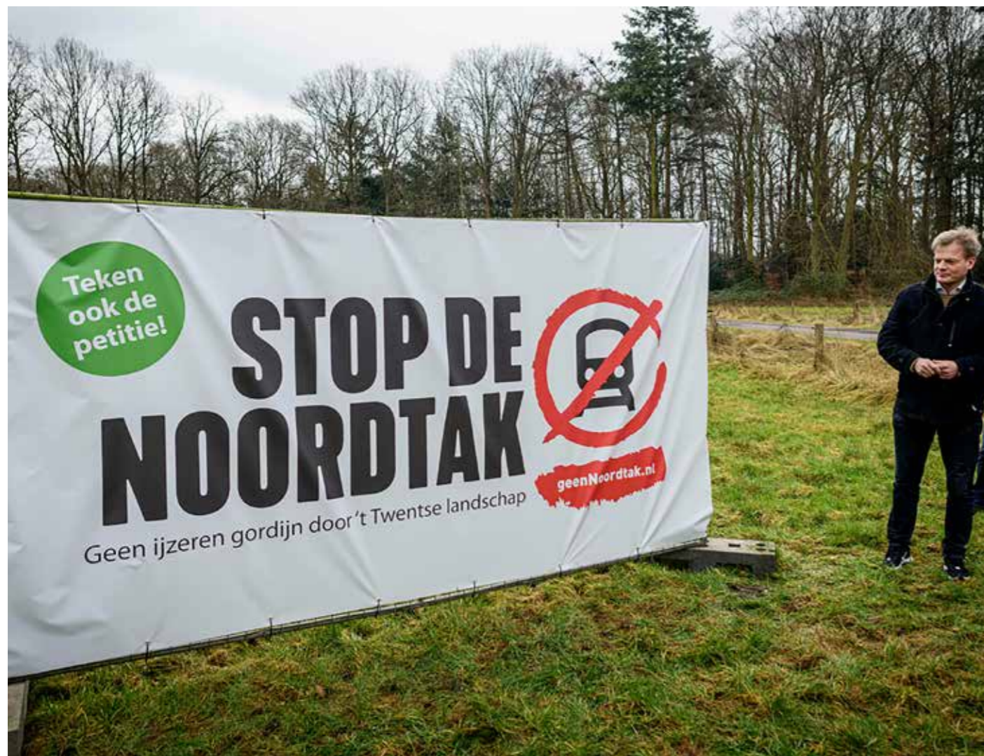
Start van de campagne 'stop de Noordtak' met Pieter Omtzigt

Beste bewoners van Twente en de Achterhoek