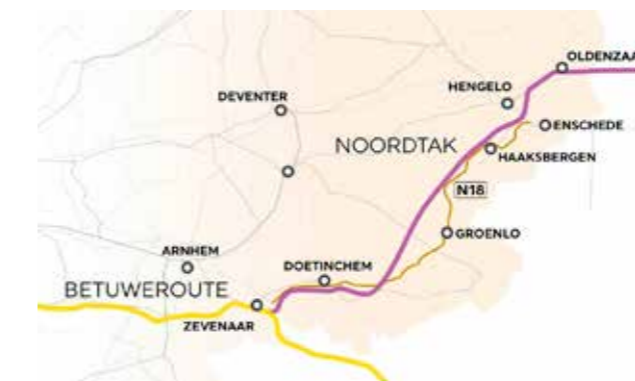
De Noordtak loopt van Zevenaar naar Oldenzaal en gaat daar de grens met Duitsland over.

De Noordtak staat voor de "Noordelijke aftakking" van de bestaande Betuweroute. Van deze Noordelijke aftakking bestaan 5 varianten, zoals weergegeven in het kaartje links. De conclusie uit het uitgelekte conceptrapport van het onderzoek is, dat de variant door de Achterhoek en Twente gezien wordt als de meest favoriete en laatste serieuze optie als Noordtak van de Betuweroute.