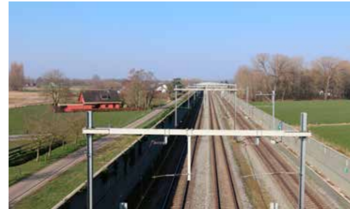
De Noordtak is geen klein spoorlijntje, maar een enorme bak beton met staal. Hij splijt het landschap in tweeën

In november gaf de Tweede Kamer met grote meerderheid opdracht om de 'Noordtak' van de Betuwelijn te onderzoeken. Deze treinroute loopt dwars door de Achterhoek en Twente. Dit geeft veel geluidsoverlast, trillingen en het maakt onze prachtige natuur kapot. En dat willen we niet!